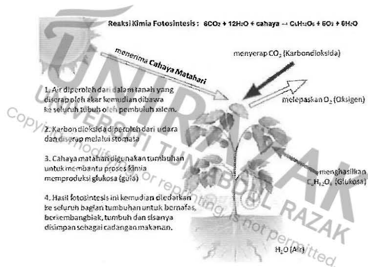
Gambar rajah 3

4. Laras bahasa ialah subset sesuatu bahasa yang digunakan untuk tujuan yang tertentu. Berdasarkan gambar rajah 3 , jawab soalan yang dikemukakan.